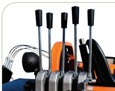
EQUIPO HIDRÁULICO INDEPENDIENTE.