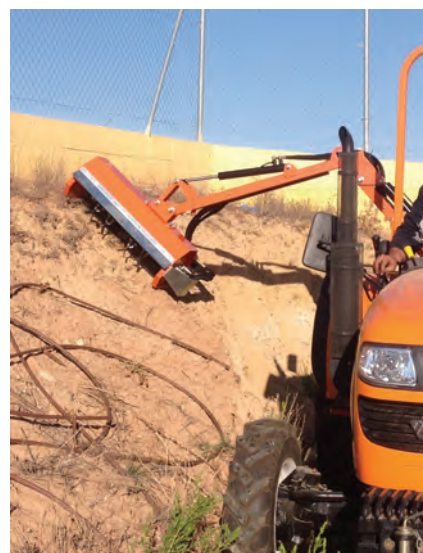
BARRA DE CUCHILLAS CON MOTOR HIDRÁULICO.