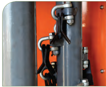
EQUIPADO CON CUCHILLAS