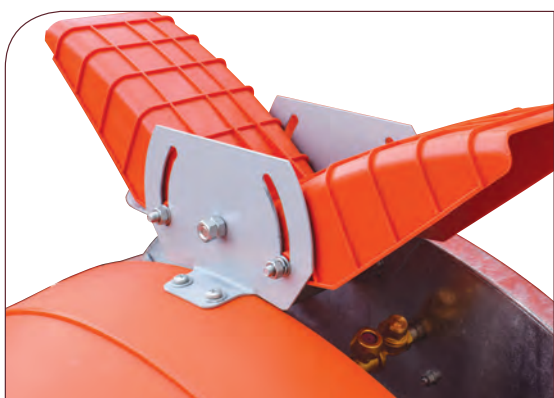
DEFLECTOR DE AIRE.