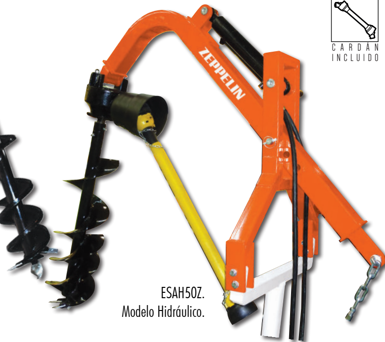
ESAH50Z. Modelo Hidráulico.