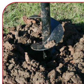
Todo tipo de suelo.