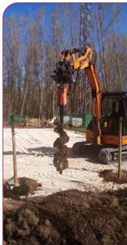
Foto ahoyadora adaptada.